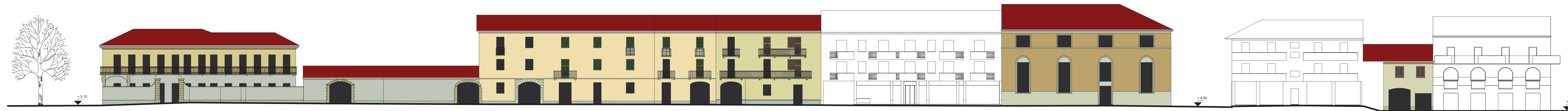
CORSO ITALIA LATO SINISTRO

TAVOLA: 14 OGGETTO: prospetto C.so Italia lato sinistro - scala 1:200 DATA: ottobre 2001 PROGETTO: dott. arch. Francesco DIEMOZ - dott. arch. Daniele VAULA' dott. arch. Antonio BESSO MARCHEIS COLLAB.: geom. Roberto PERINO - arch. Silvia GIANADA