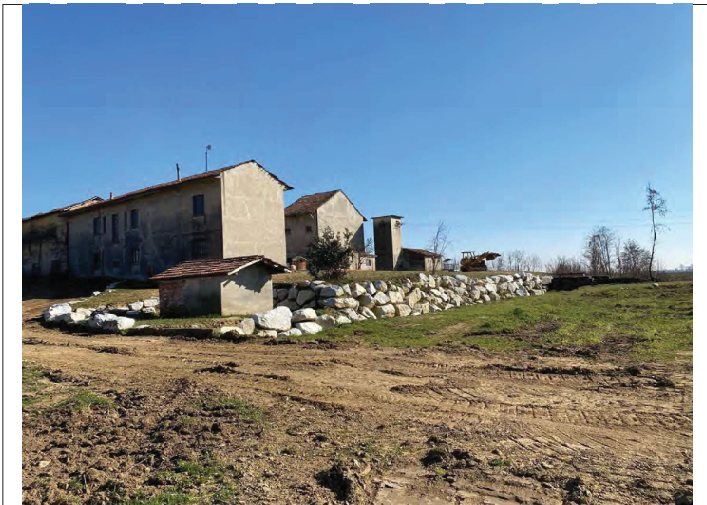
Scogliera a Ballarate