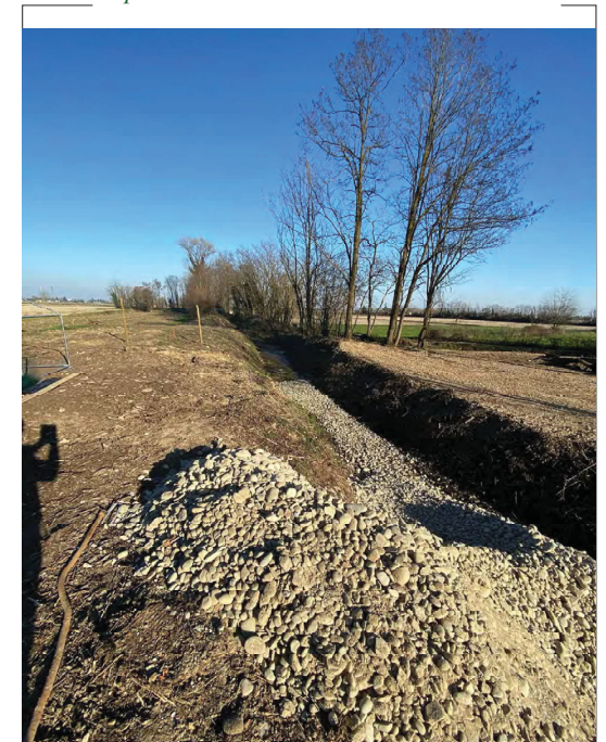
Impluvio a E di C.na Codemonte da O a E a valle edificio