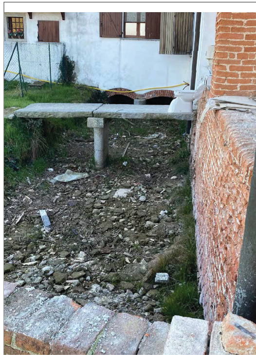
Edificio su Impluvio a E di C.na Codemonte da E a O a valle edificio dettagli sottopasso