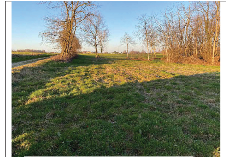
Prati a monte impluvio di Casa Bellaria Zona sulla sx strada Bulè