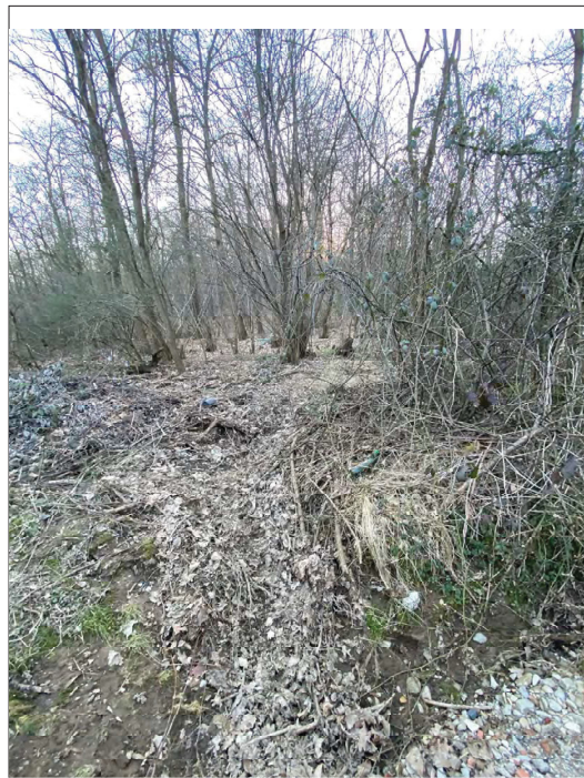
impluvio Casa Bellaria a valle verso O