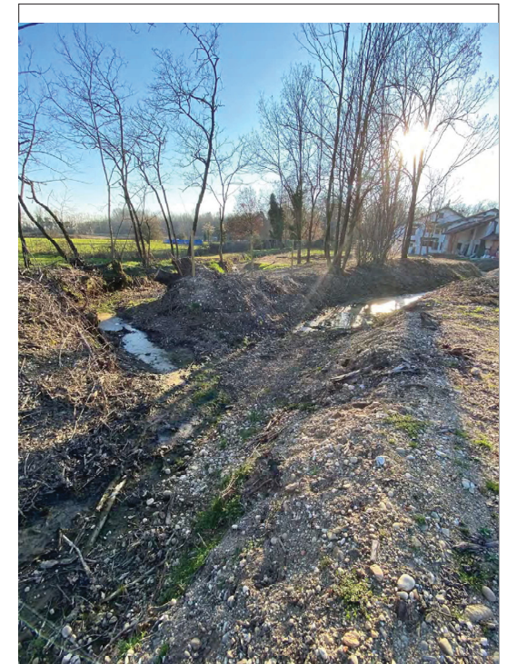
Edificio su Impluvio a E di C.na Codemonte da E a O a valle edificio zona confluenza impluvi