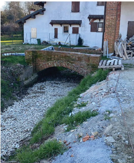
Edificio su Impluvio a E di C.na Codemonte da E a O a valle edificio