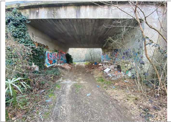
rifiuti nel sottopasso SS ticinese zona industriale