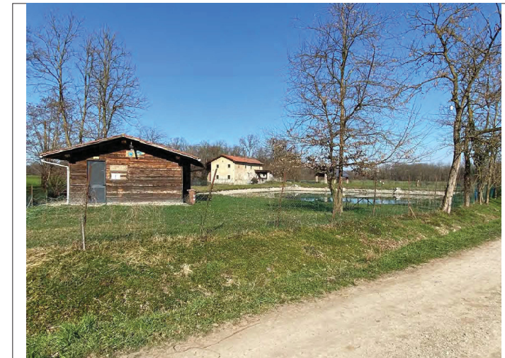
Laghetto pesca sportiva Molino Vecchio