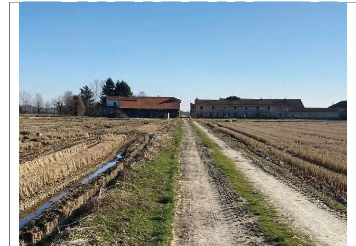
Bertinella Nuova da N verso S