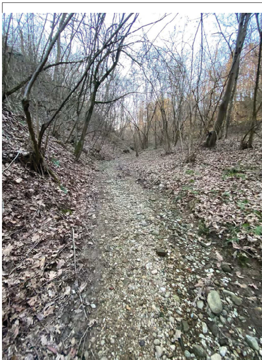
impluvio Casa Bellaria risalendo da E verso O