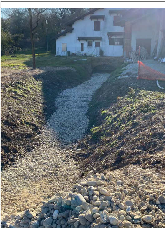
Edificio su Impluvio a E di C.na Codemonte da E a O a valle edificio