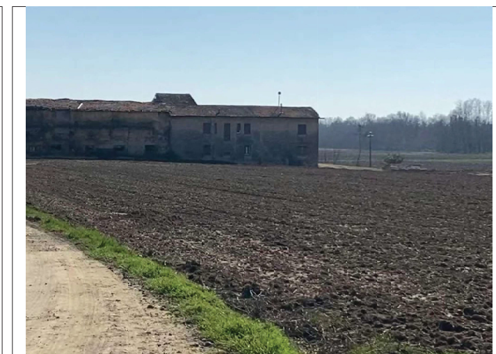
Ballarate da N verso S