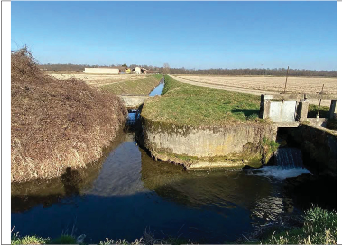
Fontanile di Bertinella Nuova (suolo sfondo) da SW a NE