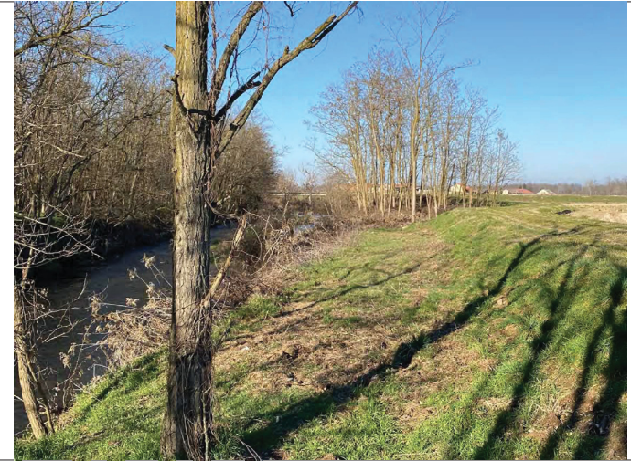
Terdoppio zona Bertinella Vecchia