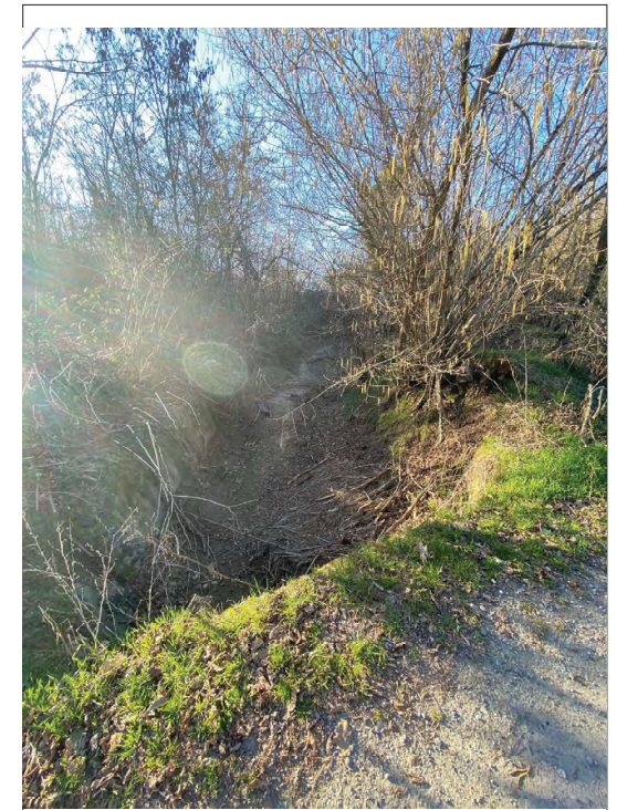
Impluvio a E di C.na Codemonte da E a O