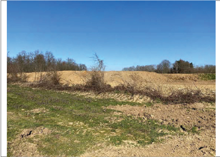
Argine a N di Ballarate