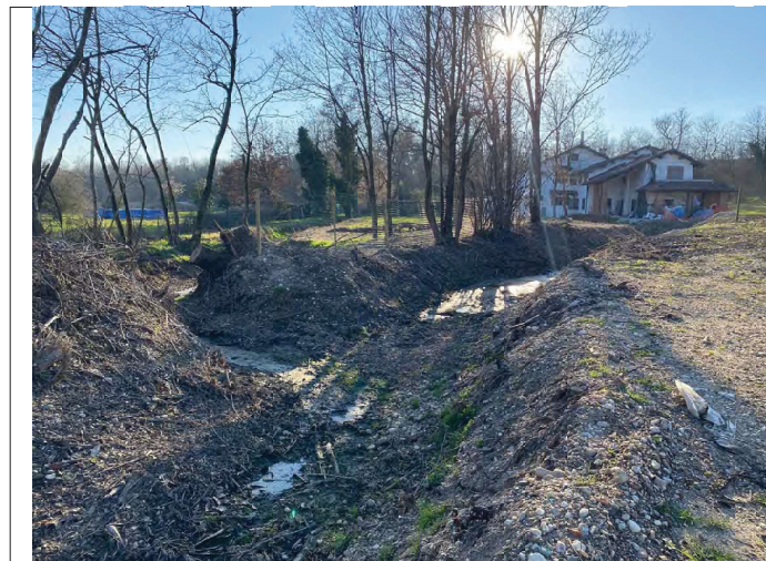
Edificio su Impluvio a E di C.na Codemonte da E a O a valle edificio zona confluenza impluvi