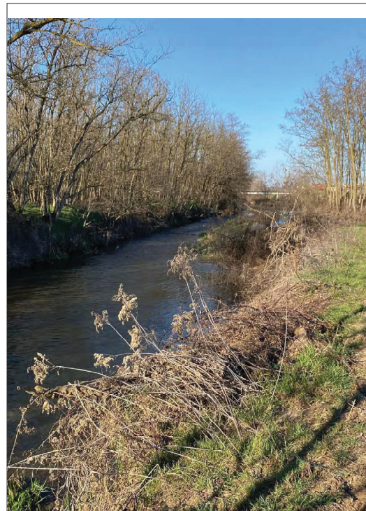
Terdoppio zona Bertinella Vecchia