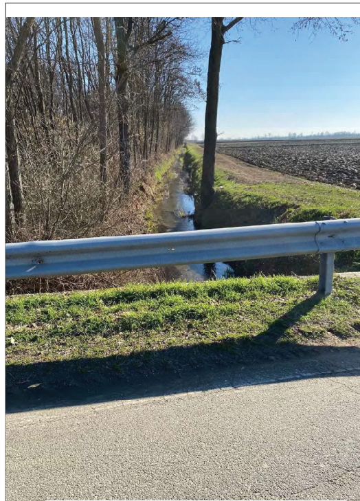
Orlandina da N verso S