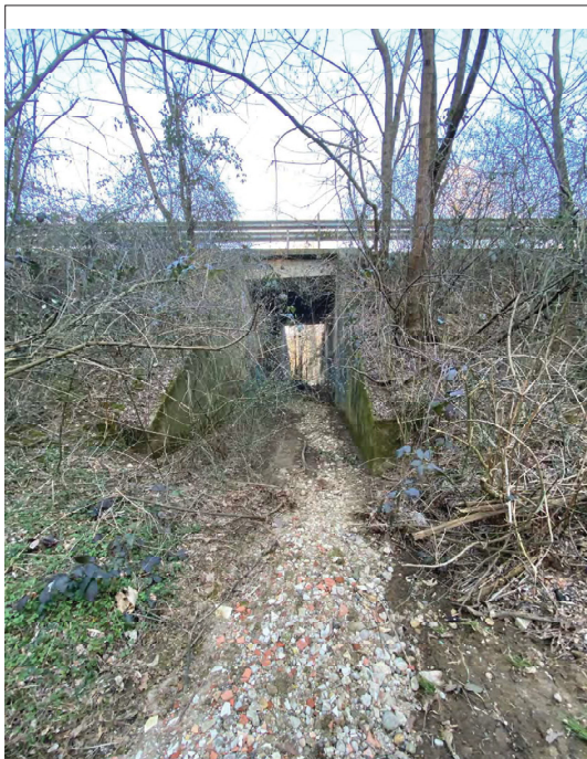
Sottopasso SS ticinese impluvio Casa Bellaria