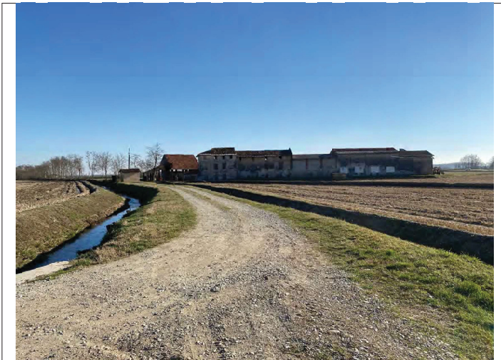
Bertinella vecchia da N verso S