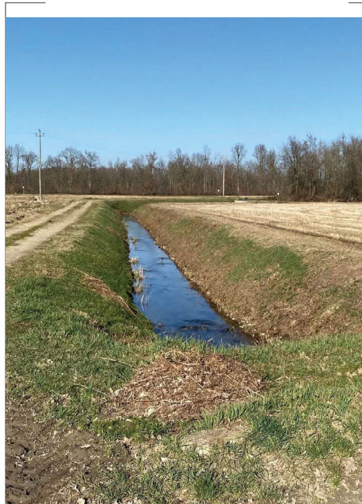
Orlandina da S verso N