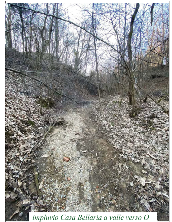
impluvio Casa Bellaria a valle verso O