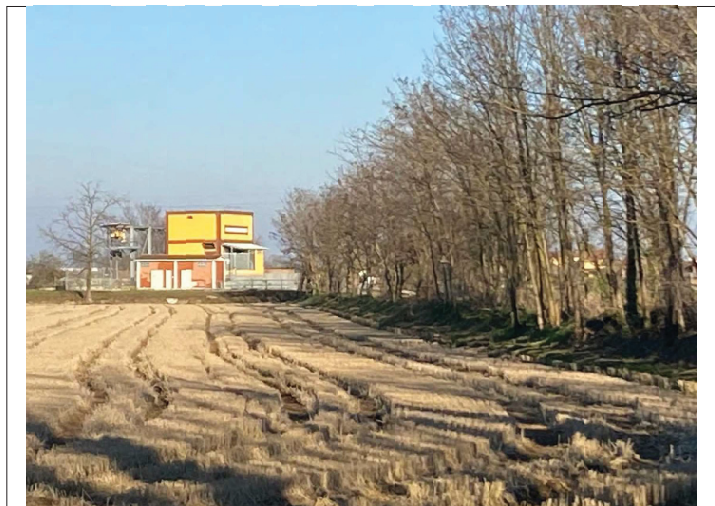
Ripresa da Edificio su Impluvio a E di C.na Codemonte da O a E a valle edificio