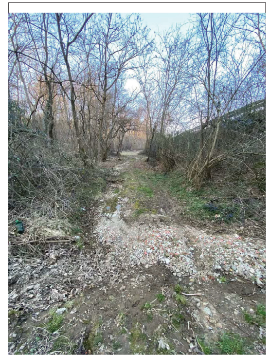
impluvio Casa Bellaria a valle verso N