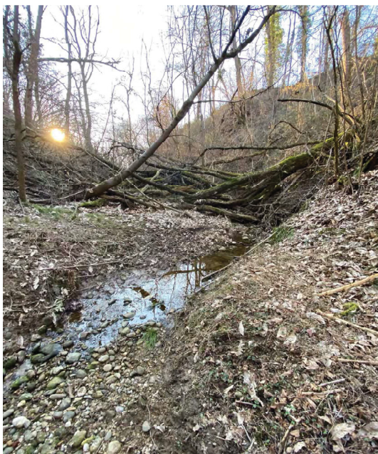
impluvio Casa Bellaria risalendo da E verso O alberi che ostruiscono deflusso