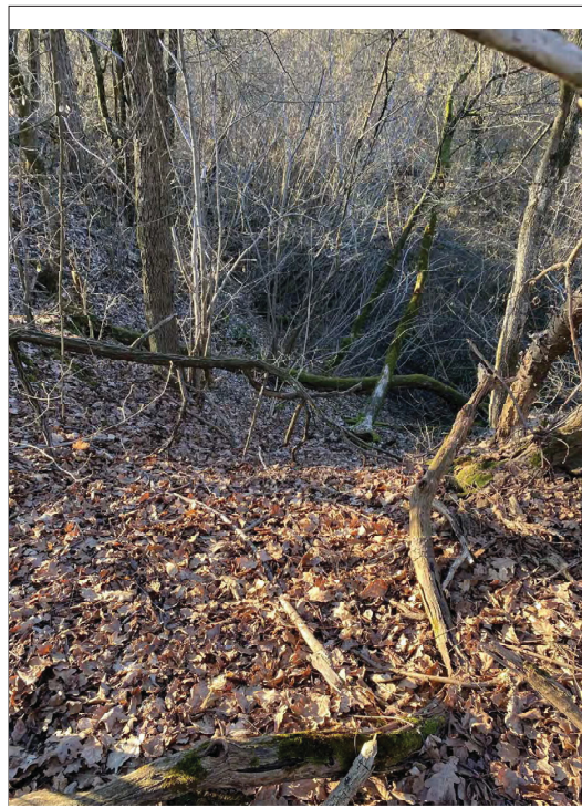
impluvio Casa Bellaria a monte da O verso E