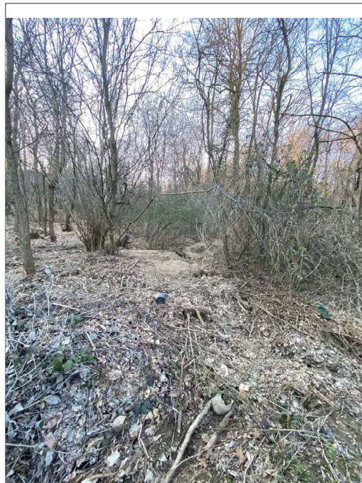
impluvio Casa Bellaria a valle verso O