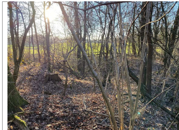
impluvio Casa Bellaria a monte da E verso O