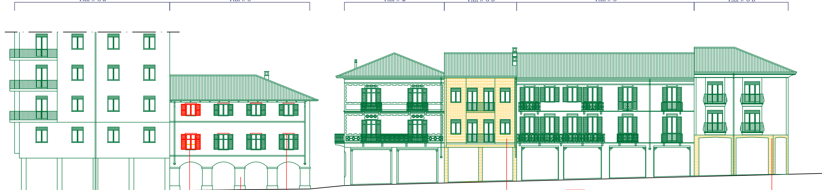
T.E. # 6 b