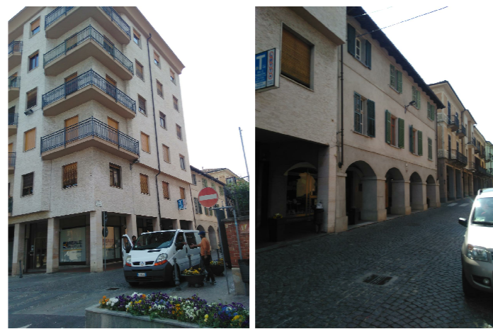
T.E. # 6a