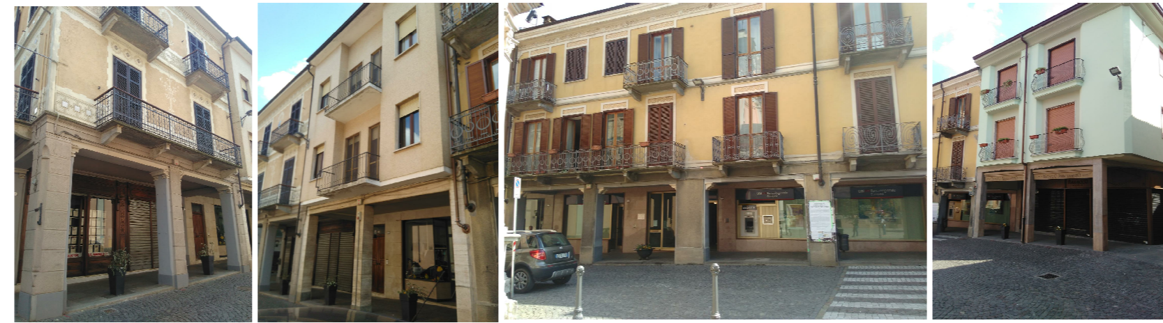
T.E. # 2