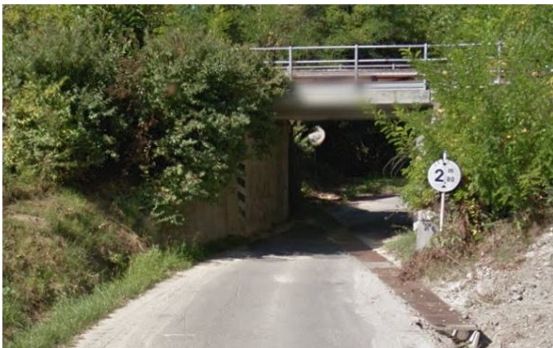
Immagine Foto Google