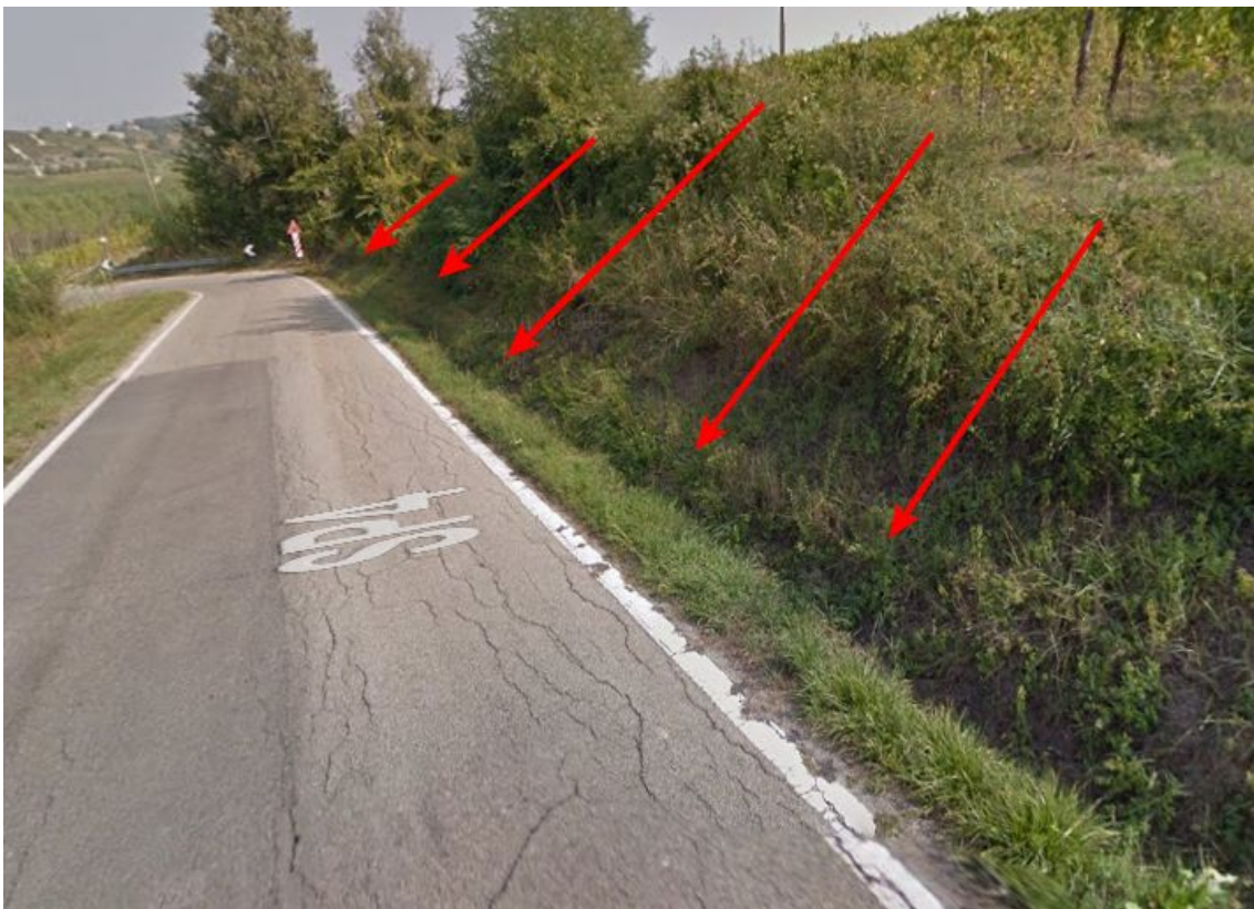
Immagine Google - Street View